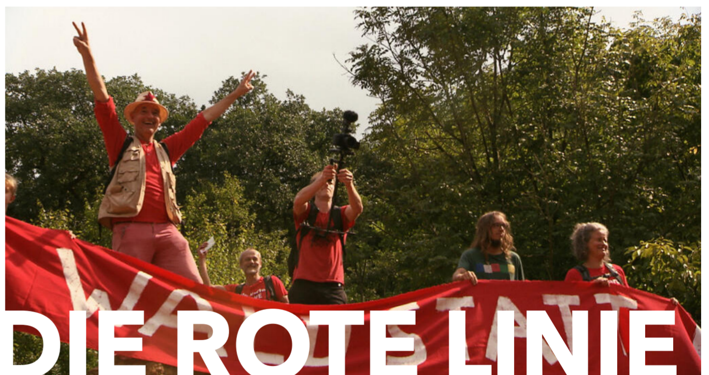
DIE ROTE LINIE