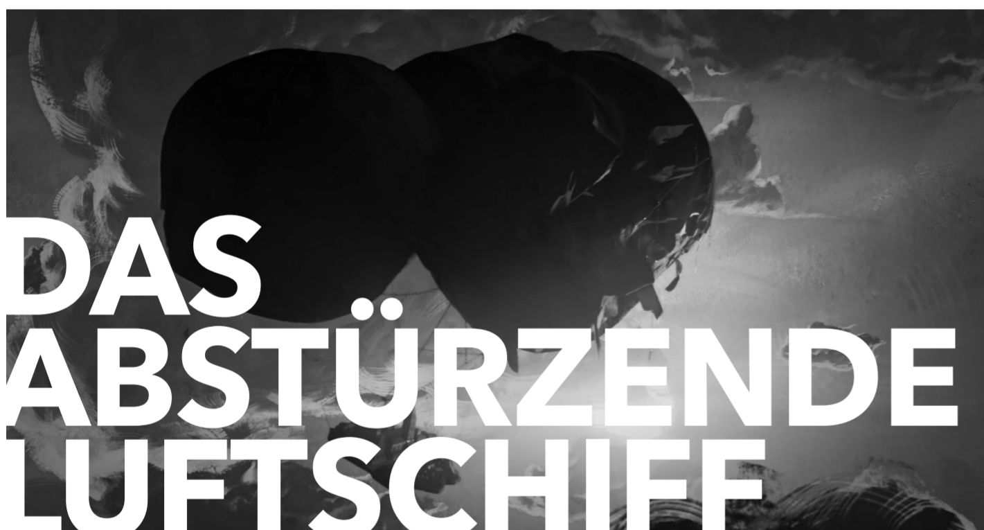
DAS ABSTÜRZENDE LUFTSCHIFF